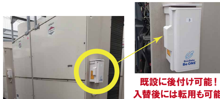
既設に後付け可能! 入替後には転用も可能!

トヨタ自動車(株)さま ダイキン工業(株)さま 三菱自動車工業(株)さまなど、 納入実績多数あり!!