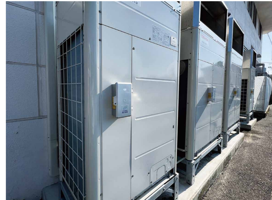
既設の室外機の横に後付けするだけで設置可能な「Be ONE」。ホール内の空気環境を損なうことなく、エアコンの消費電力を約15%削減できる。J.G.コーポレーションの空気清浄機や換気自動制御システムを併用すると、より効果的だ。

大手自動車メーカーなどに3万台以上納入されている優れモノ! 消費比率の高い空調の電力を約15%削減 空気に関わる店舗の課題解決に欠かせないパートナーである株J.G.コーポレーション。同社ではこのほど、ホール企業を悩ませる、電気料金の高騰を解消する製品を提案する。