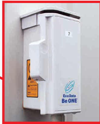
各メーカーのさまざまなエアコンに対応する

『ラスベガス鯖江店』(福井県鯖江市)は設置台数504台(パチンコ360台、パチスロ144台)の地域密着型店舗。オープン当初から快適空間づくりのパートナーとしているのが、J.G.コ