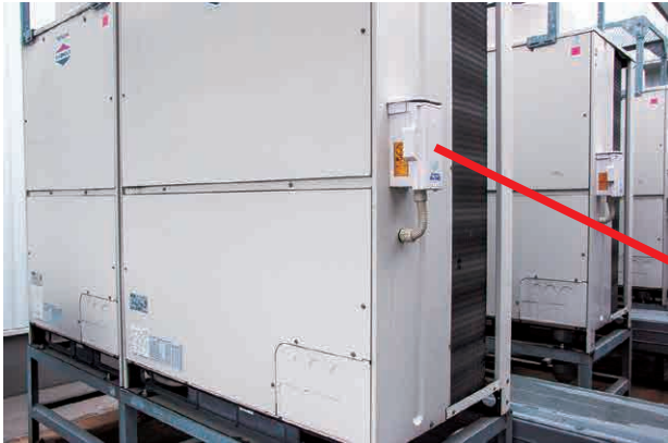
各室外機の親機に1台ずつ設置する

J.G.コーポレーションは、空気清浄機や換気自動制御システムの販売のほか、メンテナンスやアフターフォローまで空気に関わる店舗の課題すべてを解決することを目指している。現在、喫緊の課題である電気代の高騰にも最適解を提案する。